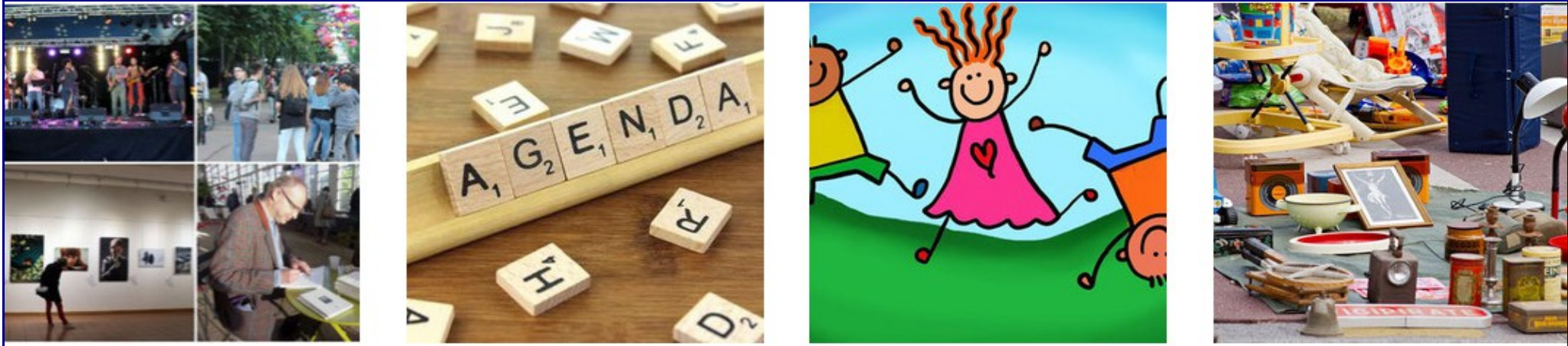
Image d'illustration, retrouvez nos quatre agendas participatifs dans notre rubrique... Agenda !

Depuis que nous passons par la plate-forme participative openagenda le gain de temps est énorme, que ce soit parce que vous êtes de plus en plus nombreux à y inscrire directement vos événements (faut dire que c'est un peu pour ça que nous passons par ce support), mais aussi parce que de plus en plus d'autres sites et projets utilisent openagenda et qu'il est possible d'agrèger les événements entre les agendas. Un système collaboratif qui nous plait bien sur, car il permet de découvrir énormément de bons moments que nous ajoutons au site, mais aussi parce que cette agrégation permet un gain de temps fou, utilisé pour aller chercher d'autres événements sur les réseaux sociaux et plusieurs sites locaux. Tout cela fait que nous pouvons annoncer de plus en plus tôt la plupart des temps forts alternatifs comme "officiels" de la vie culturelle seinomarine !